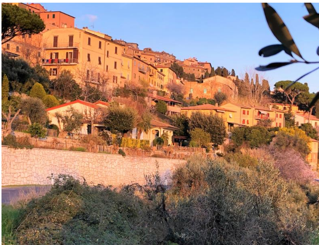
Les Collines Toscanes – Castagneto Carducci

Vidéo Séjour 2023 Le Côte des Etrusques 2023