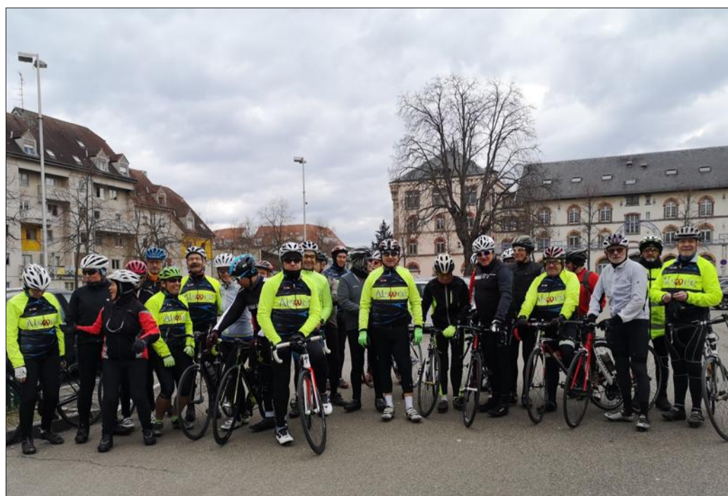
Une mise en jambes en vue du prochain voyage en Toscane.

Environ 40 cyclos ont bravé le Covid-19 et ont participé en trois groupes d'allure à cette randonnée.