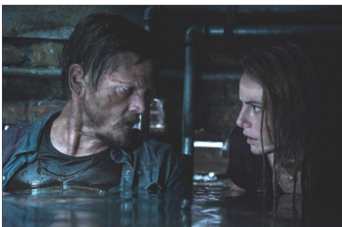
Nouveauté sur les écrans du CGR colmarien, cette semaine, Crawl ; le dernier film d'Alexandre Aja. Document remis