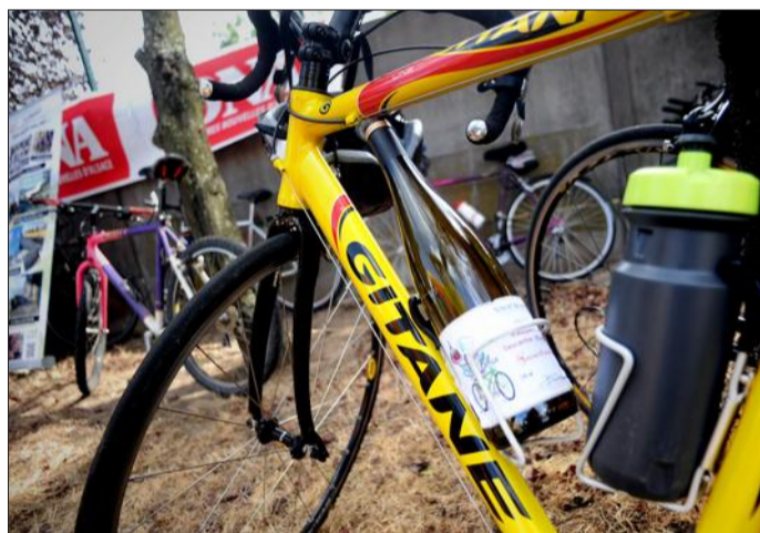
De quoi graver tous les cols. Dans le porte-gourde, un bon gewurztraminer de Turckheim.

chez des viticulteurs de Beblenheim, Ingersheim ou Westhalten, pour les plus coura-